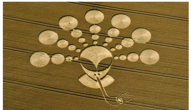
Рис. 1. Круги на полях.

Пиктограмма, изображенная на рисунке 2, была обнаружена на полях 1 июня 2014 года. Она несложная по своему исполнению, содержит знакомые нам элементы космической символики. В её верхней части виден такой символ: круг (или точка), окруженный одним внешним кольцом — обозначает разумное существо невысокого уровня развития, то есть человеческую душу с небольшим набором жизненного опыта. У разумного существа мы видим только одно информационное кольцо.